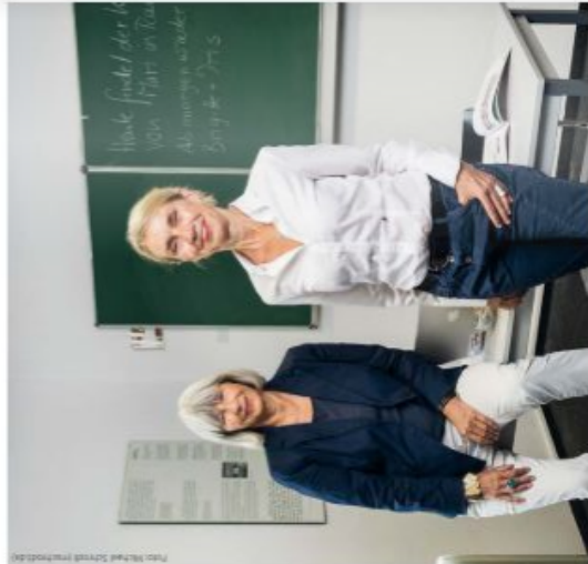
Foto: Hochschule Ravensburg-Weingarten Grafik: NDS/Erwin von der Spöck/Stockphoto.com

info@sprachdienst-konstanz.de www.sprachdienst-konstanz.de